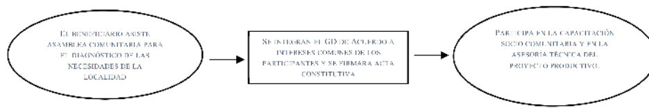
Diagrama de flujo